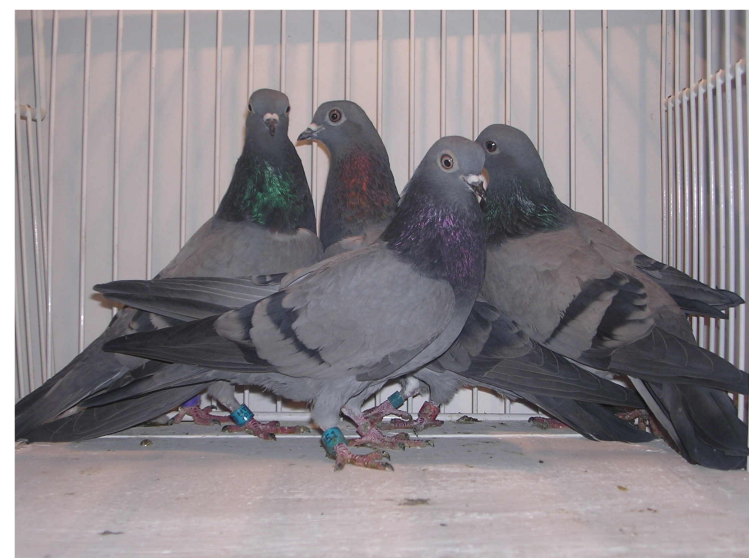
Golubovi od Hari Kočana