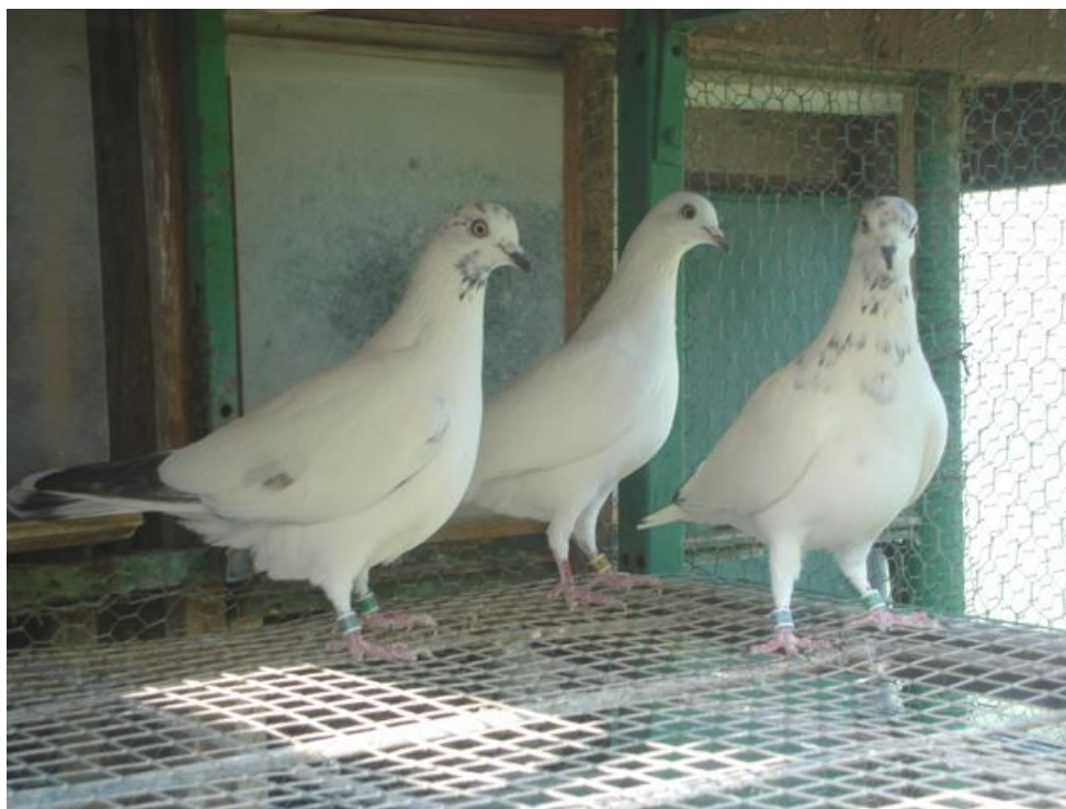
Rekorderke Hrvatske – let 20.04