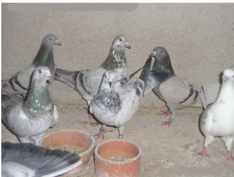
Bodenova linija tiplera